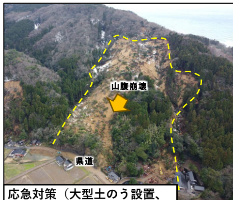
【被災状況】 珠洲市大谷の山腹崩壊