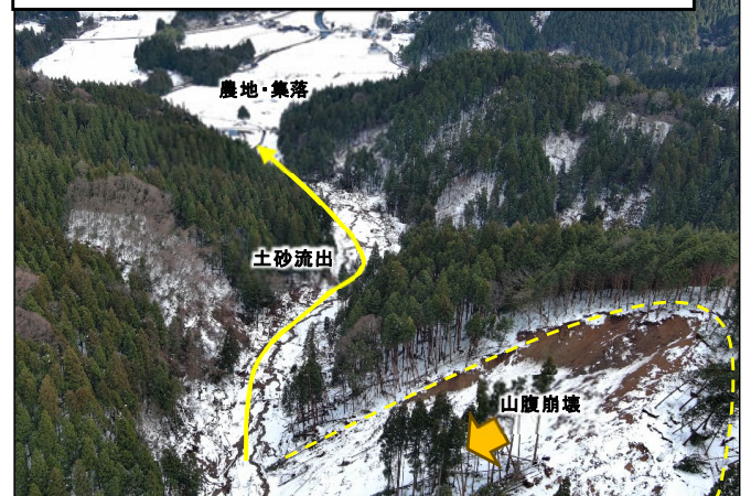
【被災状況】 輪島市興徳寺の山腹崩壊と土砂流出