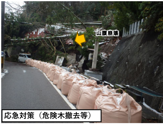
【被災状況】 輪島市鳳至の山腹崩壊